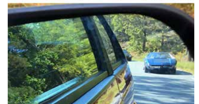
Fina vyer i backspeglarna från en Maserati biturbo.