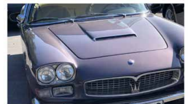
En av de sammanlagt 27 bilar som deltog; en Maserati Quattroporte I.