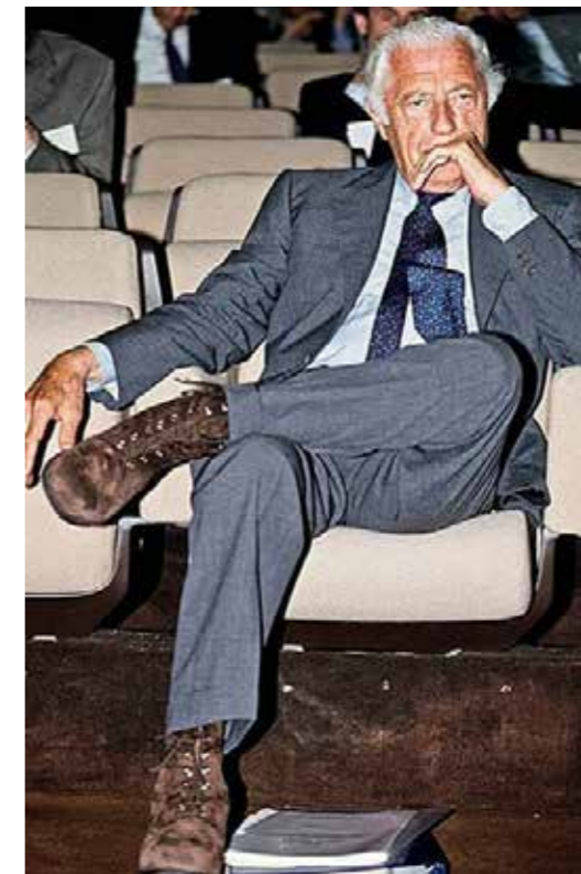
Agnellis känga till alla som bara bär lågskor till kostymen.

Att bära armbandsuret utanpå skjortmanschetten, bära kängor till den skräddarsydda kostymen och låta slipsen vara längre bak än fram är några exempel på hur han adderade små detaljer till en i övrigt klassisk (och dyr) klädstil.