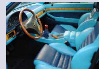
Denna spektakulära färgkombination hade de drygt 30 Primatist-bilar som producerades.

Ghibli Primatist: Byggdes som en hyllning till Maseratis framgångar inom båt-racing. Är i grunden en Ghibli GT, men med en särskild lack och en (i mitt tycke, men smaken varierar) väldigt häftig inredning.