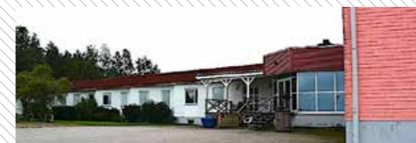
Brännebrona Gästis var tydligt inspirerat av den amerikanska motellkulturen. Detta var platsen för många intressanta träffar för 70- och 80-talets sportvagns-entusiaster. Idag är det invandrarförläggning här precis som på många andra motell, t ex Gyllene Ratten i Stockholm.

Vi befann oss i slutet av maj och att då köra genom ett soligt Sörmland är ett sant nöje. Den stora sexan i Maseratin morrade skönt och man kände verkligen motorvibrationerna ända ut i karossen. Kopplingen var extremt tungtrampad men växellådan från ZF precis och behaglig att använda. Styrningen saknade servo så man fick ta i när vägen var krokig men det gjorde inget. Vi tog vägen över Södertälje, Eskilstuna och Örebro för att så småningom närma oss Götene och Brännebrona Motell som var vårt planerade övernattningsställe. Stället hade tydlig 60-talskaraktär och var väl inte världens charmigaste men det hade en stor fördel, det var prisvärt och det låg nära Kinnekulle Ring.