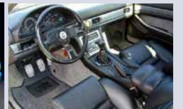
Ghibli Cup-interiör, med kolfiberinlägg (istället för valnötsträ) och Momo-ratt.

Ghibli Primatist: Byggdes som en hyllning till Maseratis framgångar inom båt-racing. Är i grunden en Ghibli GT, men med en särskild lack och en (i mitt tycke, men smaken varierar) väldigt häftig inredning.