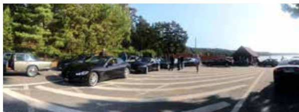
Uppställning vid Fagerholms hamn med en Maserati GranTourismo närmast i bild.

Den sköna slingan på Ingarö var lagd av Fredric Gustafsson och den började med en tur till Fagerholms båthamn där vi ställde upp oss en stund. Ett gäng unga scouter som väntade på bussen i hamnen blev nog överraskade när vi rullade in men såg helt klart nöjda ut med det brummande besöket.