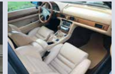
Ghibli GT-interiör: läder och valnötsträ så långt ögat kan nå.

Ghibli Cup - byggdes inspirerade från Open Cup-bilarna. Här lämnar 2,0-motorn 330HK, tack vare bland annat bättre turbo-aggregat och uppdaterad motorstyrning. Interiören är race-inspirerad med kolfiber-paneler och Momo-ratt och bilarna har split-fälgar från Speedline. Då endast ett 60-tal bilar tillverkades har bilarna idag fått en riktig samlarstatus och är den mest värdefulla Ghiblimodellen för gatan.