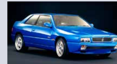
Ghibli Cup, detta exemplar i den smakfulla kulören "Blu Francia".

Ghibli Cup - byggdes inspirerade från Open Cup-bilarna. Här lämnar 2,0-motorn 330HK, tack vare bland annat bättre turbo-aggregat och uppdaterad motorstyrning. Interiören är race-inspirerad med kolfiber-paneler och Momo-ratt och bilarna har split-fälgar från Speedline. Då endast ett 60-tal bilar tillverkades har bilarna idag fått en riktig samlarstatus och är den mest värdefulla Ghiblimodellen för gatan.