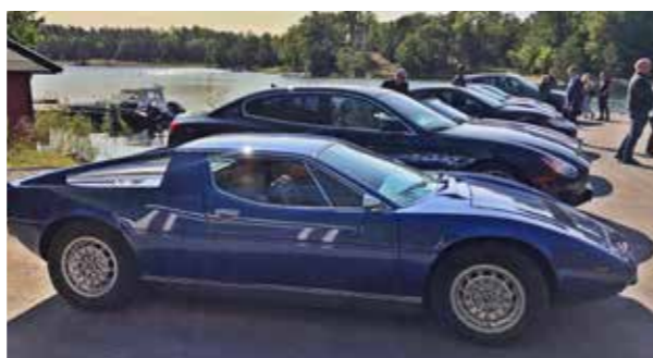
En ovanlig syn; en nyrenoverad blå Maserati Merak SS deltog.

Vi lyckades bryta upp alla trevliga umgängen och färden gick vidare till Ekenäs brygga. Alla dessa sköna italienska Maseratis och vacker svensk skärgårdsmiljö gifte sig på ett mycket fördelaktigt sätt, som synes på bilden. Det blev ett snabbt stopp och vidare färd mot lunchen på Björkviks krog.