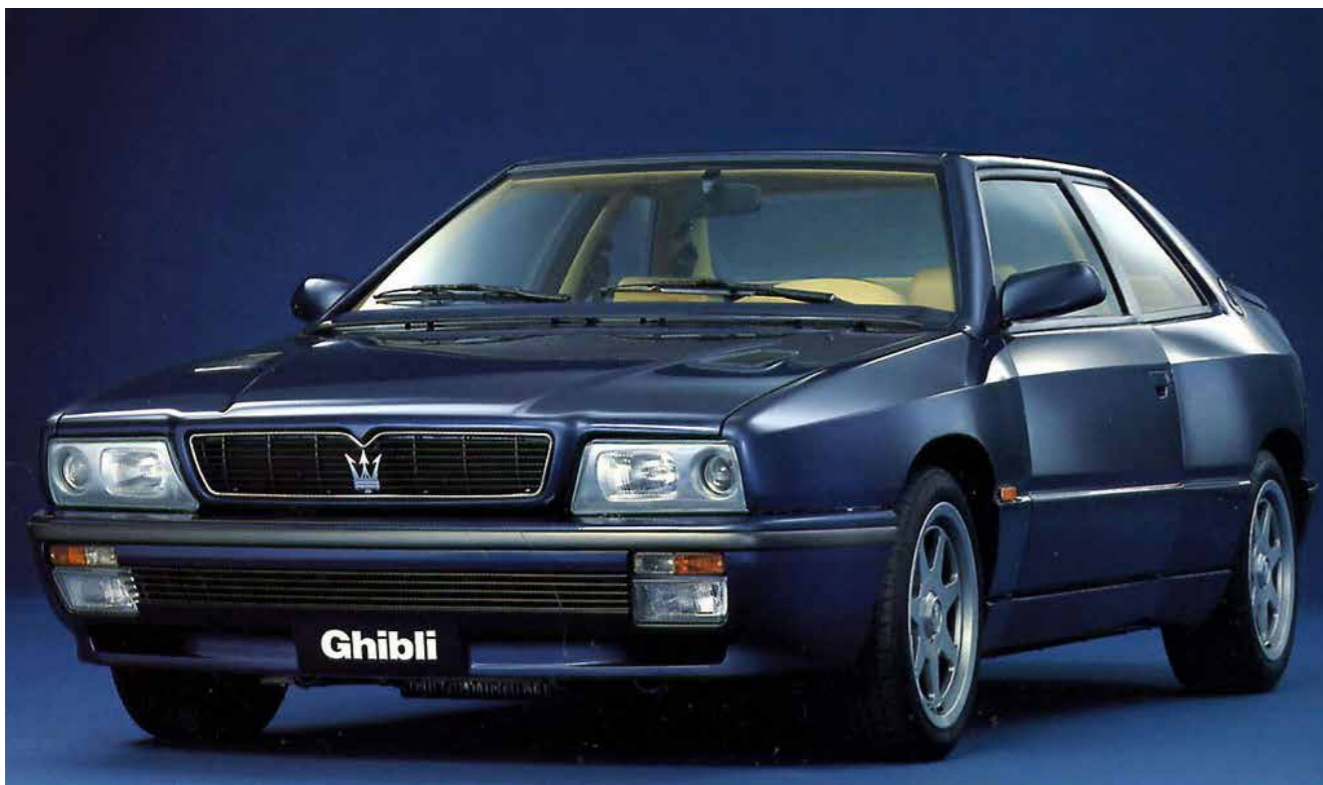
Ghibli II från lanseringsåret 1992, då med 16-tums OZ Racing-fälgar.