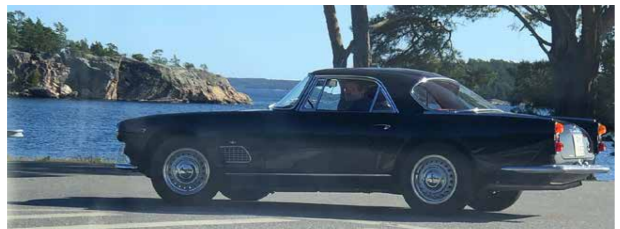
Träffens enda Maserati 3500 GTI rullar in vid Björkvik.