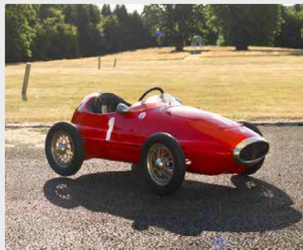
En härlig trampbil inspirerad av Maserati 250F. Bonhams

250F verkar vara en mycket populär förlaga för så kallade baby cars. Dess framgångsrika racinghistoria och ikoniska utseende lämnar ingen oberörd. Kreativa föräldrar och släktingar men även seriösa leksakstillverkare har skapat allsköns inofficiella varianter av 250F med små motorer som drivs av bensin eller el. Det förekommer så klart också fina tramp- och lådbilar à la 250F utan motor.