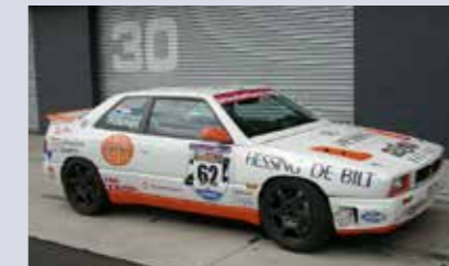
Ghibli Open Cup Evo från 1996. Evolutionen i förhållande till 1995 bestod bland annat av större bromsar och fälgar samt förbättrad aerodynamik.

Ghibli Open Cup - bilar tillverkade enkom för bankörning, togs fram för en enhetsserie som kördes på europeiska banor under 1995 och 1996. Bilarna är i grunden Ghibli GT 2,0-bilar, rensade på inredning, men har en del special-utrustning såsom kraftigare bromsar och en modifierad framvagn. Inför 1996-säsongen fick bilarna dessutom ytterligare uppgraderingar.