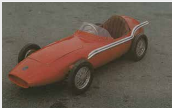
Batteridrivna Maserati 250F, årsmodell 1957.