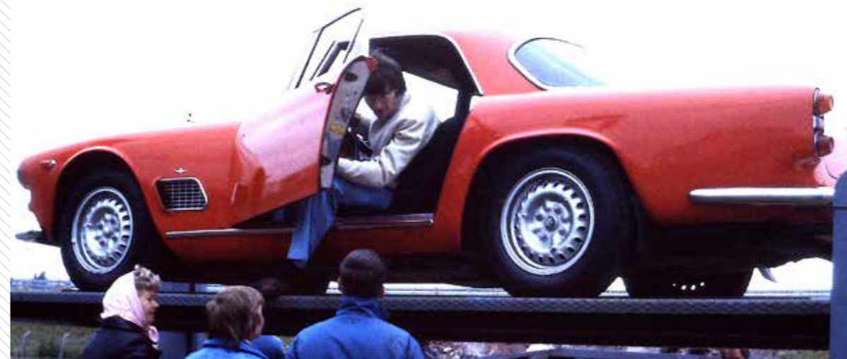
– "Hur ser det ut?" – "Det är kört, kopplingshaveri", blev svaret och så var den banträffen förstörd.

Ett annat år senare var jag och min fru på väg till Kinnekulle med en Alfa Giulia Spider 1964. Strax efter Örebro började det droppa olja under instrumentbrädan. Märkligt. När vi stod vid vägkanten och funderade på vad nästa steg skulle bli passerade en mindre Fiat. Bilen stannade och ägaren hoppade ur och undrade vad som hänt. Jag berättade och han tittade in under instrumentbrädan. Det är ledningen till oljetryckmätaren som läcker sa han. Ganska enkelt att reparera men jag måste först hinna till IKEA och köpa några saker. Vi väntade och en dryg halvtimme kom han tillbaka och tog oss på släp till ett hus mitt ute i skogen. Där bodde han bland diverse fordon, de flesta av italienskt ursprung. Minns speciellt att det stod en Ducati-motorcykel i badkaret. Felet reparerades ganska snabbt genom att plugga hålet i motorn där oljetrycket hämtades. Han ville inte ha någon ersättning för jobbet utan önskade oss trevlig resa. Den gången kom vi precis lagom till Gorskis historier på Brännebrona och vi hade även en egen att berätta. Efteråt konstaterade jag att hjälpen vi fått aldrig skulle komma om vi kört en Golf. Å andra sidan hade säkert inte problemet uppstått heller.