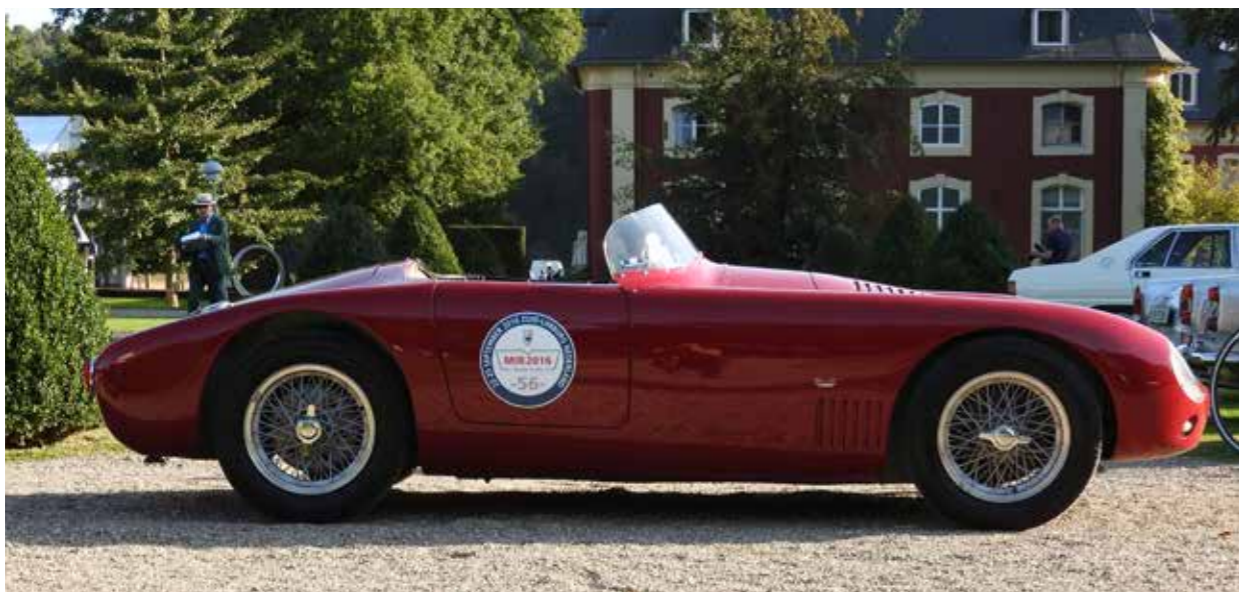
Enda deltagande OSCA var en M.T.4 från 1954.