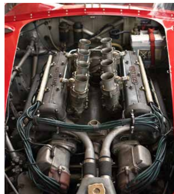
450S prototypen ägs idag av en för några klubbmedlemmar känd Italiensk Maserati entusiast och samlare.