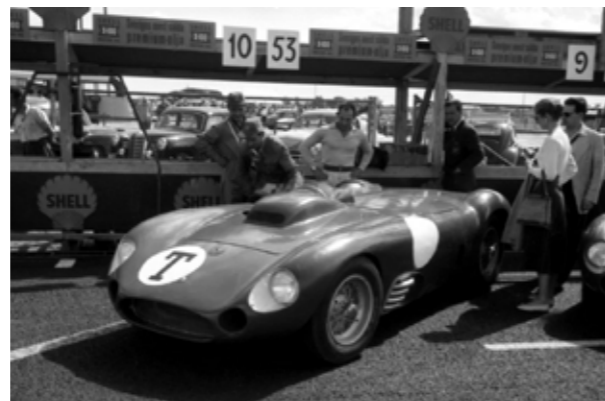
Stirling Moss koncentrerad inför provkörning av 4501

4501 visade sig ha en mycket stor potential med avseende på acceleration och toppfart. Chassit kunde dock inte hantera V-8ans överväldigande kraft. Vid denna debut var motorn fortfarande i sin experimen-